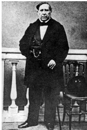
Fig. 1. Giovanni Gorgone (San Piero Patti, 15 dicembre 1801 – Palermo, 4 febbraio 1868)

messinese, Giovanni Gorgone all'età di quindici anni si era iscritto alla Facoltà di Medicina di Palermo 4 ; dopo la laurea, per ottenere una migliore preparazione in Anatomia e Chirurgia, Gorgone si trasferisce a Napoli, frequenta la scuola di maestri all'epoca illustri (Pappaleo e Santoro) e, dopo quattro anni, consegue il dottorato in Chirurgia 5 . Al termine del soggiorno, rientra nel 1825 a Palermo e già l'anno seguente, dopo un concorso controverso, curriculum e titoli gli consentono di ottenere poco più che ventenne l'affidamento della cattedra di Anatomia (decreto di nomina dell'11 luglio di quell'anno). Ma quale situazione trova nell'Istituto al momento del suo arrivo? Ecco, stando a Pitrè, qual era lo stato dell'insegnamento e dell'Istituto di Anatomia al momento in cui Gorgone sale in cattedra: