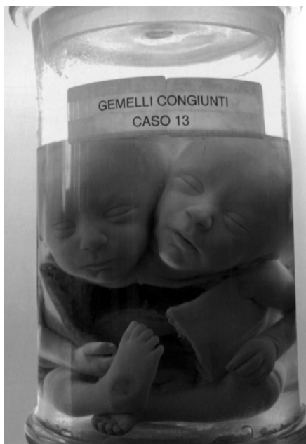
Fig. 3. Museo di Anatomia Patologica. Gemelli congiunti.

vati dal manuale di Saint-Hilaire. Sempre sul cartello era indicato il numero della storia e il nome del donatore, qualora esistessero. Un'analisi dettagliata del catalogo del 1859 ha rivelato alcuni dati piuttosto interessanti: su una collezione che aveva una consistenza complessiva di 520 pezzi, ben 124 (24%) risultano accompagnati dalla loro storia clinica, cui si fa riferimento rimandando ad altre opere a stampa del Gorgone stesso o di suoi allievi (tav. 1).