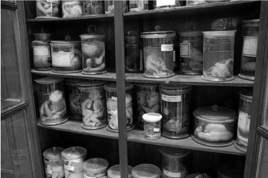
Fig. 2. Museo di Anatomia Patologica. Bachecca dei gemelli teratologici.

Vista la condizione di degrado in cui versa la collezione, per procedere ad un esame della consistenza e della composizione dei reperti si è scelto in prima battuta di partire dall'analisi del materiale elencato nel catalogo stilato da Gorgone nel 1859, che costituisce del resto il nucleo originario della collezione. Si rimanda invece ad un momento successivo, in cui prenderà avvio un'opera di ripristino e riordino, l'esame della collezione per come si presenta allo stato attuale.