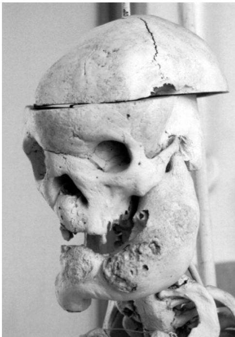
Fig. 4. Museo di Anatomia Patologica. Scheletro di egiziano acromegalico.

limitandosi a esplicitare quando non si tratti di reperti necroscopici ma di modelli in cera. Risulta comunque evidente che la tecnica di conservazione in formaldeide sia in assoluto quella prevalente 25 . Il numero dei modelli in cera nella collezione del 1859 risulta invece piuttosto elevato, perché è pari a 118 su 520 (23%) (tav. 2). Il criterio di classificazione adottato da Gorgone era quello ritenuto all'epoca il più moderno, ovvero quello del Gabinetto Dupuytren di Parigi 26 , in seguito contestato da chi gli succedette sulla cattedra. La classificazione dei pezzi patologici era "anatomica" e "per classi" 27 , "giusta la divisione della mia opera di anatomia 28 , aggiungendovi tre classi, cioè i corpi estranei 29 , le mostruosità, e le anomalie" 30 ; queste ultime, secondo Gorgone, potevano star bene "tanto in un Gabinetto Patologico che in uno Igido, poiché esiste un campo neutro in cui le due scienze possono entrambe estendere le proprie indagini" 31 . Per tali ragioni egli colloca le anomalie in uno scaffale separato. Per quanto concerne il criterio di selezione dei pezzi patologici, Gorgone spiega invece di avere seguito due parametri: rarità e importanza della patologia.